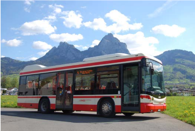
Bus mit Mythen im Hintergrund