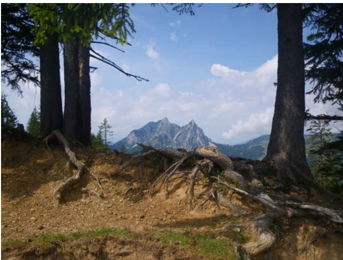
Wanderung im Banne der Mythen